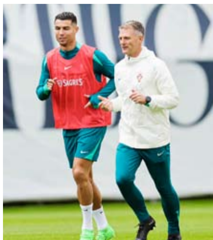
القائد كريستيانو رونالدو

وقال دياز، قلب دفاع مانشستر سيتي بطل إنجلترا: أود أن أقول إنه مصدر إلهام، إنه يجعل كل شيء ممكناً، ويمثل كل ما يمكن أن يحلم به المرء.