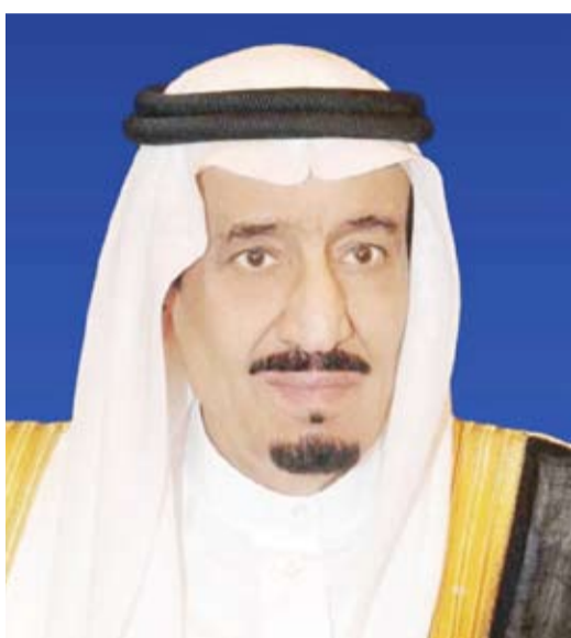
خادم الحرمين الشريفين الملك سلمان بن عبدالعزيز

بعث صاحب السمو أمير البلاد الشيخ مشعل الأحمد، ببرقية تهنئة إلى أخيه خادم الحرمين الشريفين الملك سلمان بن عبدالعزيز، ملك المملكة العربية السعودية الشقيقة بمناسبة نجاح موسم الحج لهذا العام 1445هـ، أعرب فيها سموه عن خالص تهنائه بالنجاح الكبير الذي تحقق بفضل الله تعالى، ثم بفضل ما أولاه خادم الحرمين الشريفين وحكومته الرشيدة، ممثلة بكافة الوزارات والقطاعات في المملكة العربية السعودية الشقيقة من عناية كريمة ساهمت بكل جدارة في إنجاحه، مشيداً سموه بالخطوات الوثابة لأعمال التوسعة ونموها التي يشهدها بيت الله الحرام واستحداث الخدمات والتقنيات الذكية الحديثة المنتشرة في كافة المشاعر التي تلبى احتياجات الحجاج وتعود عليهم بالنفع وتيسير أداء المناسك والتي هي دائماً محل إشادة وتقدير وثناء الجميع، مثنياً سموه الدور الكبير لأخيه صاحب السمو الملكي الأمير خالد الفيصل بن عبدالعزيز مستشار خادم الحرمين الشريفين أمير منطقة مكة المكرمة رئيس لجنة الحج المركزية ولأخيه صاحب السمو الملكي الأمير عبدالعزيز بن سعود بن نايف وزير الداخلية رئيس لجنة الحج العليا، لما يعكفان عليه من عمل دؤوب ومتواصل ولما يوليانه من اهتمام معهود وجهود مقدرة من خلال التنسيق والتكامل بين كافة القطاعات المعنية بتنفيذ خطة الحج على أفضل وجه سائلاً سموه الباري جل وعلا، أن يتقبل من الجميع خالص الدعاء وصالح الأعمال في هذه الأيام المباركة، وأن ينعم على المملكة العربية السعودية الشقيقة وشعبها الكريم بالمزيد من التقدم والأزدهار في ظل القيادة الحكيمة والرشيده لخادم الحرمين الشريفين الملك سلمان بن عبدالعزيز ملك المملكة العربية السعودية الشقيقة.