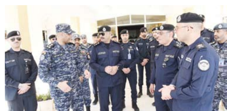
الفريق الشيخ سالم النواف خلال جولته التفقدية

قام وكيل وزارة الداخلية الفريق الشيخ سالم النواف، في ثاني أيام عيد الأضحى المبارك، بجولة تفقدية شملت مخفر شرطة الغصن وشرطة سعد العبدالله ومركز الإيواء للعمال للوقوف على الجاهزية والاستعداد والاطلاع على سير العمل. وقالت (الداخلية) في بيان صحفي: إن الفريق الشيخ سالم النواف نقل في بداية جولته تحيات وتهاني النائب الأول لرئيس مجلس الوزراء ووزير الدفاع ووزير الداخلية الشيخ فهد اليوسف لمنسوبي قطاع الأمن العام بمناسبة عيد الأضحى المبارك. وأضافت أن الفريق الشيخ سالم النواف،