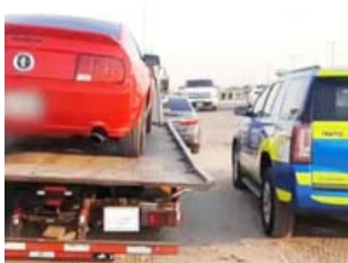
مصادرة سيارة المستهتر

أعلنت وزارة الداخلية، ضبط مخالفين لقانون الإقامة بسكن العزاب في «بنيد القار» أعلنت وزارة الداخلية، ضبط مخالفين لقانون العمل «المادة 20»، وذلك في سكن العزاب بمنطقة بنيد القار. ووفقاً لما نشرته «الداخلية» عبر حسابها في منصة «إكس» فقد تم نقلهم إلى مركز الإيواء للعمال مع توفير كافة الاحتياجات لهم والالتزام بالجانب الإنساني.