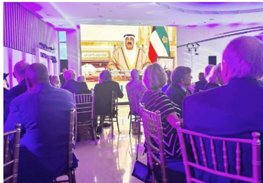
سمو أمير البلاد يلقي كلمة مسجلة بافتتاح الجناح الجديد مكتبة جورج بوش الأب

القيم النبيلة والسامية ونقدم أحر التهاني بمناسبة افتتاح الجناح الجديد مكتبة جورج بوش الذي يمثل مركزاً للمعرفة. وختاماً، نجدد امتناننا العميق لإرث الرئيس جورج بوش الأب وللولايات المتحدة الأمريكية الصديقة مقدرين روح التضامن والصداقة وتهانينا الحارة وأمنياتنا للجميع بمزيد من التقدم والتميز.