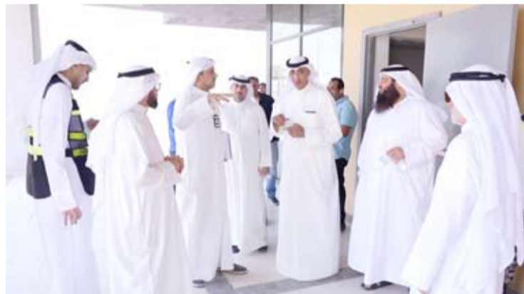
د.محمود بوشهري خلال تفقده أحد المشاريع

أكد وزير الكهرباء والماء والطاقة المتجددة وزير الدولة لشؤون الإسكان، الدكتور محمود بوشهري، أول أمس، الحرص على إزالة كافة العقبات التي من شأنها تأخير إنجاز المشاريع التنموية.