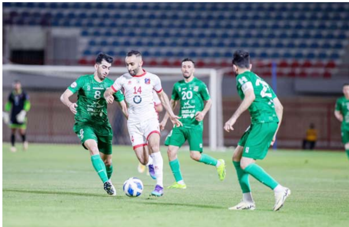
عمري أحد المحترفين في صفوف العميد الكويتي