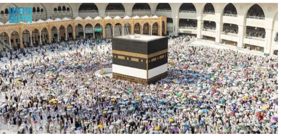
حجاج بيت الله الحرام يؤدون طواف الوداع

الله تعالى ثم بفضل ما أولاه أخيه خادم الحرمين الشريفين وسمو ولي العهد رئيس مجلس الوزراء والحكومة الرشيدة. وقد أدى حجاج بيت الله الحرام من المتعجلين، أمس، طواف الوداع وسط استعدادات مكثفة من الهيئة العامة للعناية بشؤون المسجد الحرام والمسجد النبوي الشريف بمشاركة الجهات المعنية العاملة بالحج لتفويج ضيوف الرحمن وذلك وفق الخطط التشغيلية لموسم حج هذا العام وسط منظومة متكاملة من الخدمات.