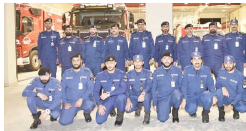
اللواء خالد فهد و عدد من قوة الإطفاء

سيطرت فرق الإطفاء ظهر اليوم الثلاثاء، على حريق طراد في ساحه ترابية بمنطقة المسيلة حيث تمت مكافحة الحريق والسيطرة عليه دون وقوع إصابات. من جهة أخرى تفقد رئيس قوة الإطفاء العام بالتكليف اللواء خالد فهد عدد من مراكز قوة الإطفاء لهنتهم بعيد الأضحى المبارك والتأكيد من جاهزية الفرق، ونقل تحيات وتهاني النائب الأول لرئيس مجلس الوزراء ووزير الدفاع