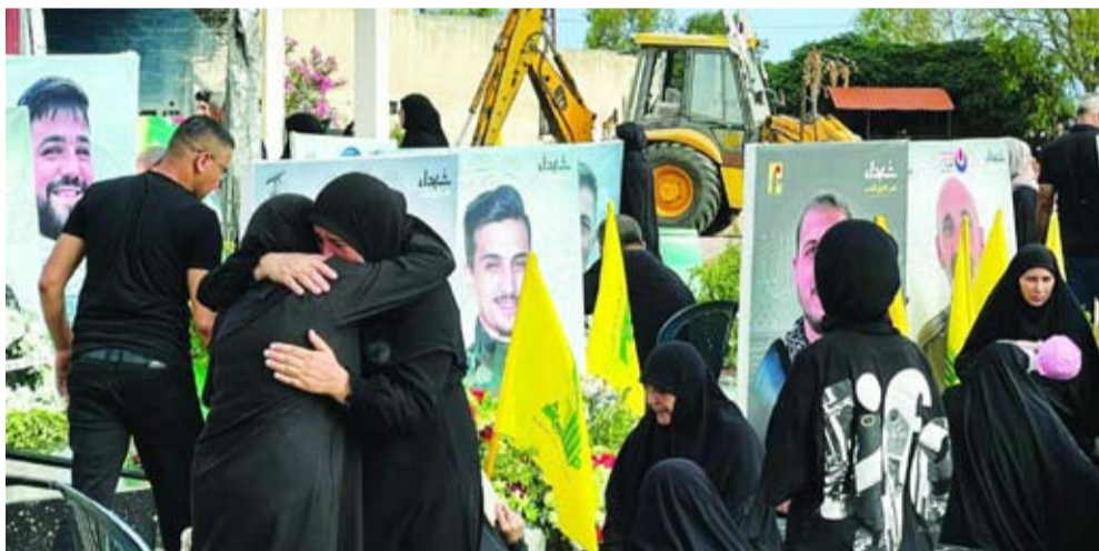
أقارب لمقاتلين من «حزب الله» يزورون مقبرة في الناقورة

تجدد التصعيد في جنوب لبنان، عشية وصول مبعوث الرئيس الأمريكي الخاص لشؤون أمن الطاقة، أموس هوكستين، إلى بيروت، في محطته الثانية في المنطقة التي استهلها بزيارة إسرائيل، والتي استقبلها «حزب الله» بتأكيد أن «المنطقة العازلة» ليست موضع نقاش. والنقى هوكستين رئيس الوزراء الإسرائيلي بنيامين نتنياهو وفريقه في القدس. وقال المتحدث باسم الحكومة الإسرائيلية، ديفيد منسر: «ندافع عن أنفسنا من عدوان (حزب الله). لا نزاع حول الأراضي بين لبنان وإسرائيل». ويلتقي هوكستين في بيروت رئيس البرلمان نبيه بري، ورئيس حكومة تصريف الأعمال نجيب ميقاتي. وقال النائب عن «حزب الله» حسن فضل الله: «فكرة المنطقة العازلة، هي وهام تراود قادة العدو وليست موضوعاً للنقاش؛ لأن المقاومة موجودة في أرضها وتدافع عنها، بينما العدو هو من يحتل أرض الشعب الفلسطيني والسوري واللبناني، وعليه أن يخرج منها».