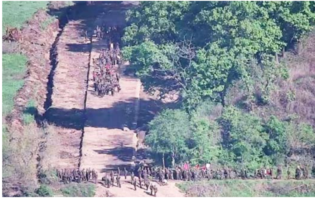
جنود كوريون شماليون بالقرب من الحدود

بدأت روسيا مناورات بحرية في المحيط الهادئ، تشمل تدريبات على عمليات مضادة للغواصات وللضربات الجوية، وفق ما أعلنت وزارة الدفاع الروسية في بيان. ويأتي هذا الإعلان قبيل زيارة يقوم بها الرئيس الروسي فلاديمير بوتين لكوريا الشمالية، بهدف إقامة شراكة استراتيجية بين موسكو وبيونغ يانغ اللتين تجمعهما «روابط الأخوة الراسخة لرفاق السلاح»، بحسب ما قال الزعيم الكوري الشمالي كيم جونج أون. وتستمر هذه المناورات التي يشارك فيها نحو 40 زورقاً وقارباً وسفينة بالإضافة إلى نحو 20 طائرة مروحية «من 18 إلى 28 يونيو في مياه المحيط الهادئ وبحر اليابان وأوخوتسك» في أقصى الشرق الروسي، وفق ما أوضحت وزارة الدفاع الروسية. ويظهر مقطع فيديو نشرته الوزارة الكثير من السفن والغواصات تجر قبالة بحر اليابان في فلاديفوستوك، الميناء الرئيسي للأسطول الروسي في المحيط الهادئ. وأشارت الوزارة إلى أنه «في مراحل مختلفة، سيقوم البحارة بتدريبات على عمليات مضادة للغواصات وعلى الضربات الصاروخية ضد مجموعات من سفن عدو تقليدي وصد هجمات مسيرة جوية وبحرية».