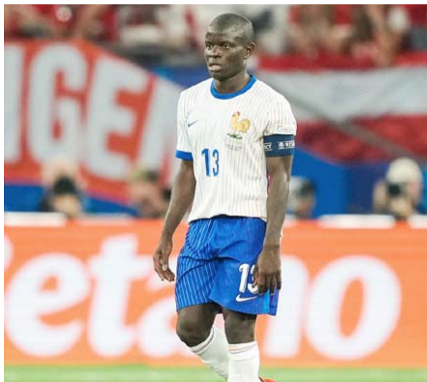
كانتي الأفضل في الديوك

استهل المنتخب الفرنسي مشواره في بطولة كأس أوروبا «يورو 2024»، المقامة حالياً في ألمانيا، بالفوز على نظيره النمساوي بهدف دون رد ضمن منافسات الجولة الأولى بالمجموعة الرابعة.