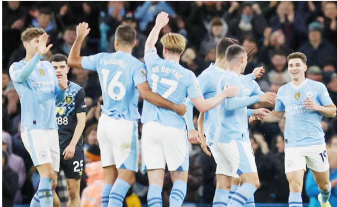
سيتي حامل اللقب للمرة الخامسة على التوالي

وكشفت رابطة الدوري الإنجليزي الممتاز لكرة القدم أن مانشستر سيتي سيستهل حملة الدفاع عن لقبه الخامس على التوالي برحلة إلى ستامفورد بريدج لمواجهة تشيلسي في 18 أغسطس المقبل.