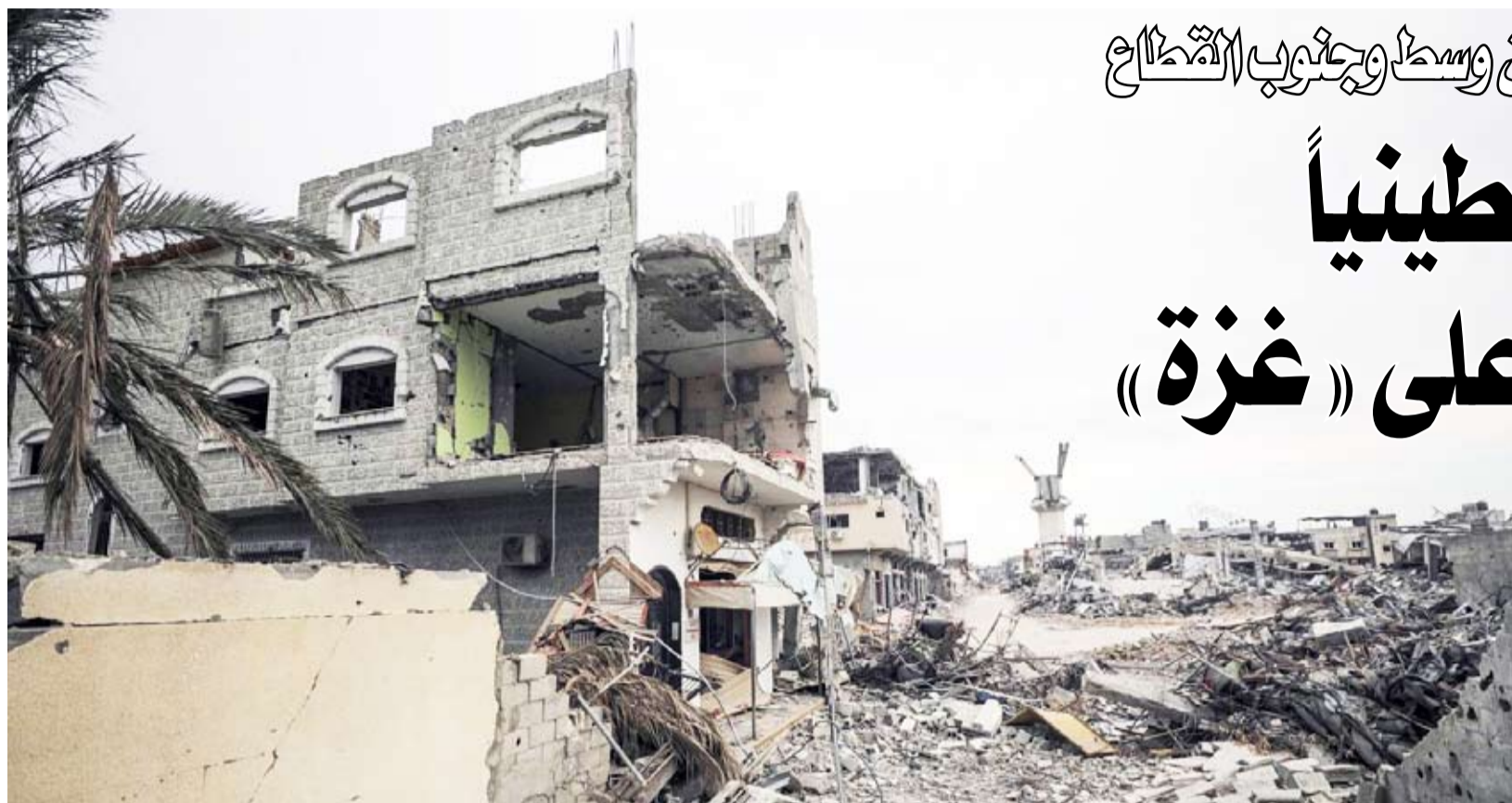
جانب من الدمار في قطاع غزة

طالب الرئيس الفرنسي إيمانويل ماكرون ونظيره التشيلي غابرييل بوريك بوقف دائم لإطلاق النار بين إسرائيل والفصائل الفلسطينية في قطاع غزة. جاء ذلك خلال لقائهما، في قصر الإليزيه، بحسب بيان صادر عن الرئاسة الفرنسية. وأشار البيان إلى أن الرئيسين بحثنا الوضع في أوكرانيا والشرق الأوسط.