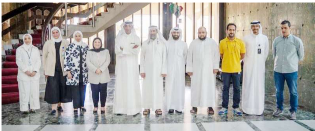
وزير الكهرباء متوسط موظفي الوزارة

أكد وزير الكهرباء والماء والطاقة المتجددة وزير الدولة لشؤون الإسكان الدكتور محمود بوشهري استقرار وضع الطاقة الكهربائية، مشيراً إلى جهودها لتلبية احتياجات الدولة من الطاقة الكهربائية والتعامل مع أي طارئ قد يحدث بسبب زيادة الأحمال نتيجة لارتفاع درجات الحرارة. ودعا بوشهري خلال زيارته مركز التحكم الوطني أمس، للاطلاع على سير العمل وكيفية إدارة شبكة الكهرباء الوطنية جميع العملاء إلى ترشيد الاستهلاك خلال فترات الذروة والممتدة من الساعة 11:00 صباحاً حتى 5:00 عصرًا لما لذلك من أثر ملموس على استدامة الطاقة الكهربائية.