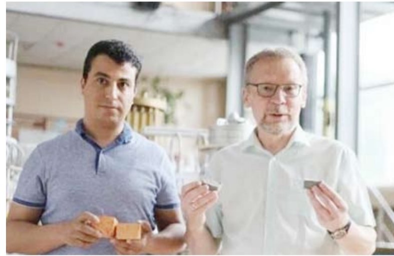
تطوير مادة جديدة للحماية من الإشعاعات النووية